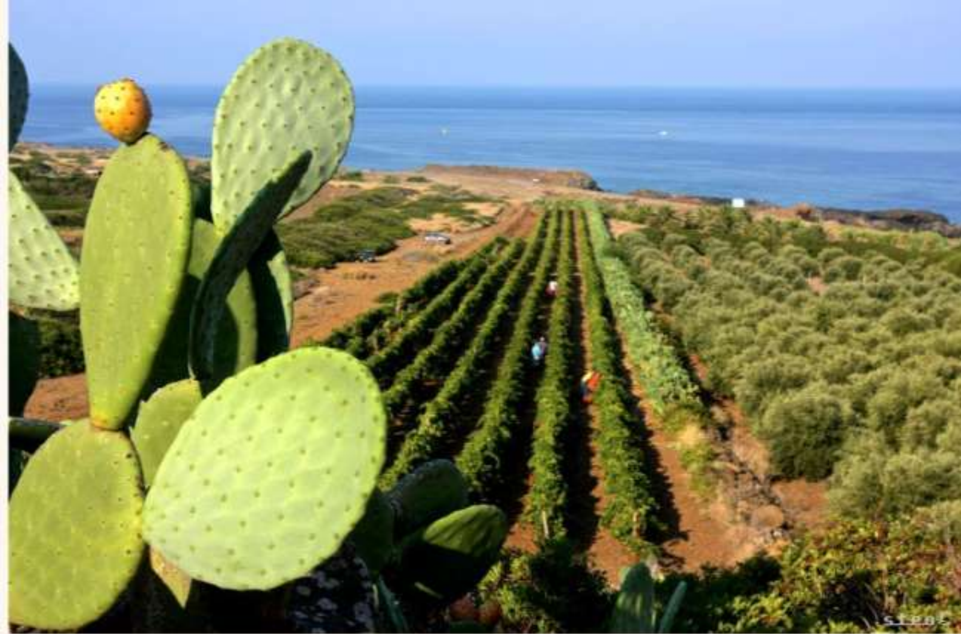
ISOLA DI USTICA