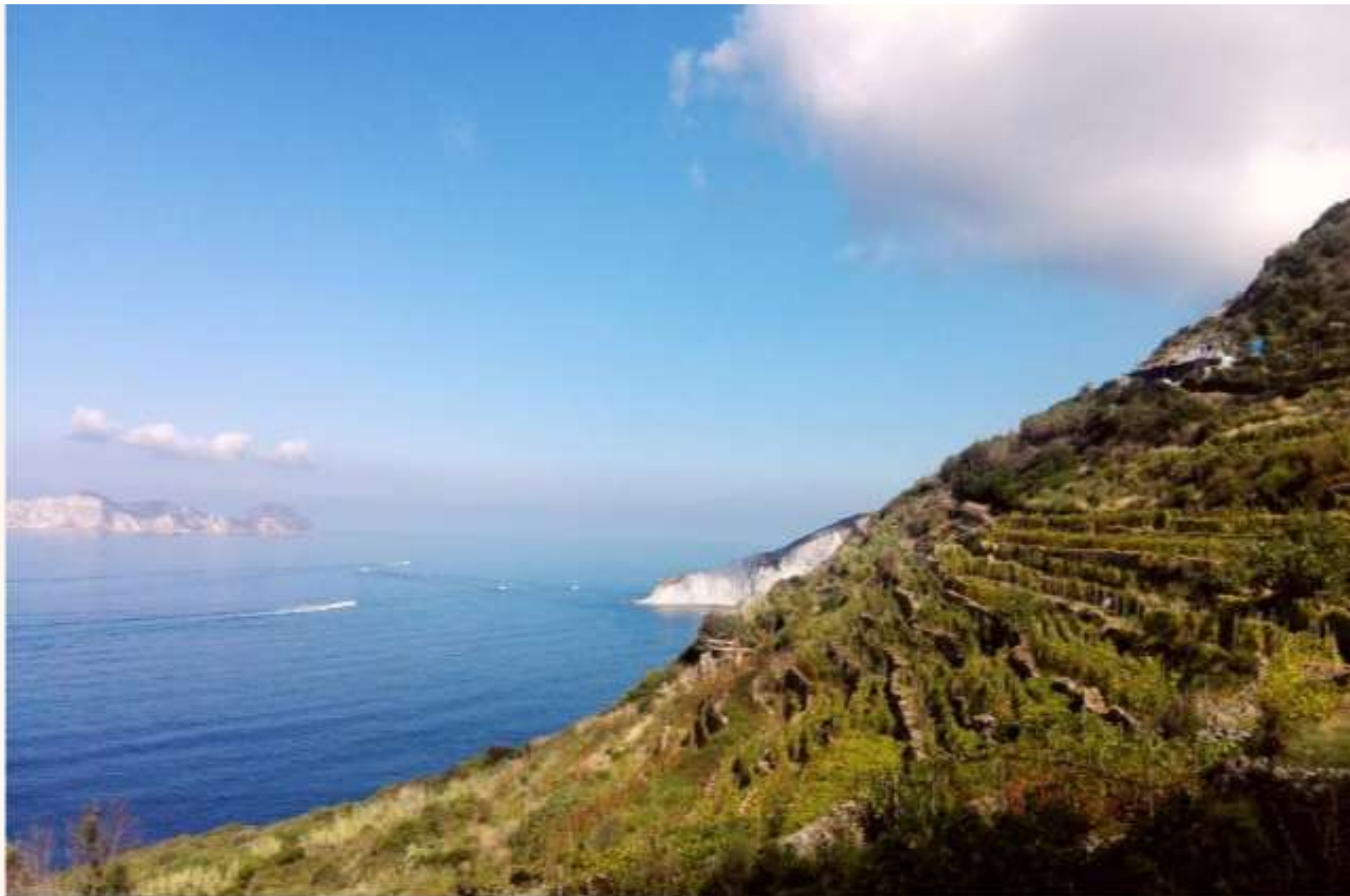
ISOLA DI PONZA