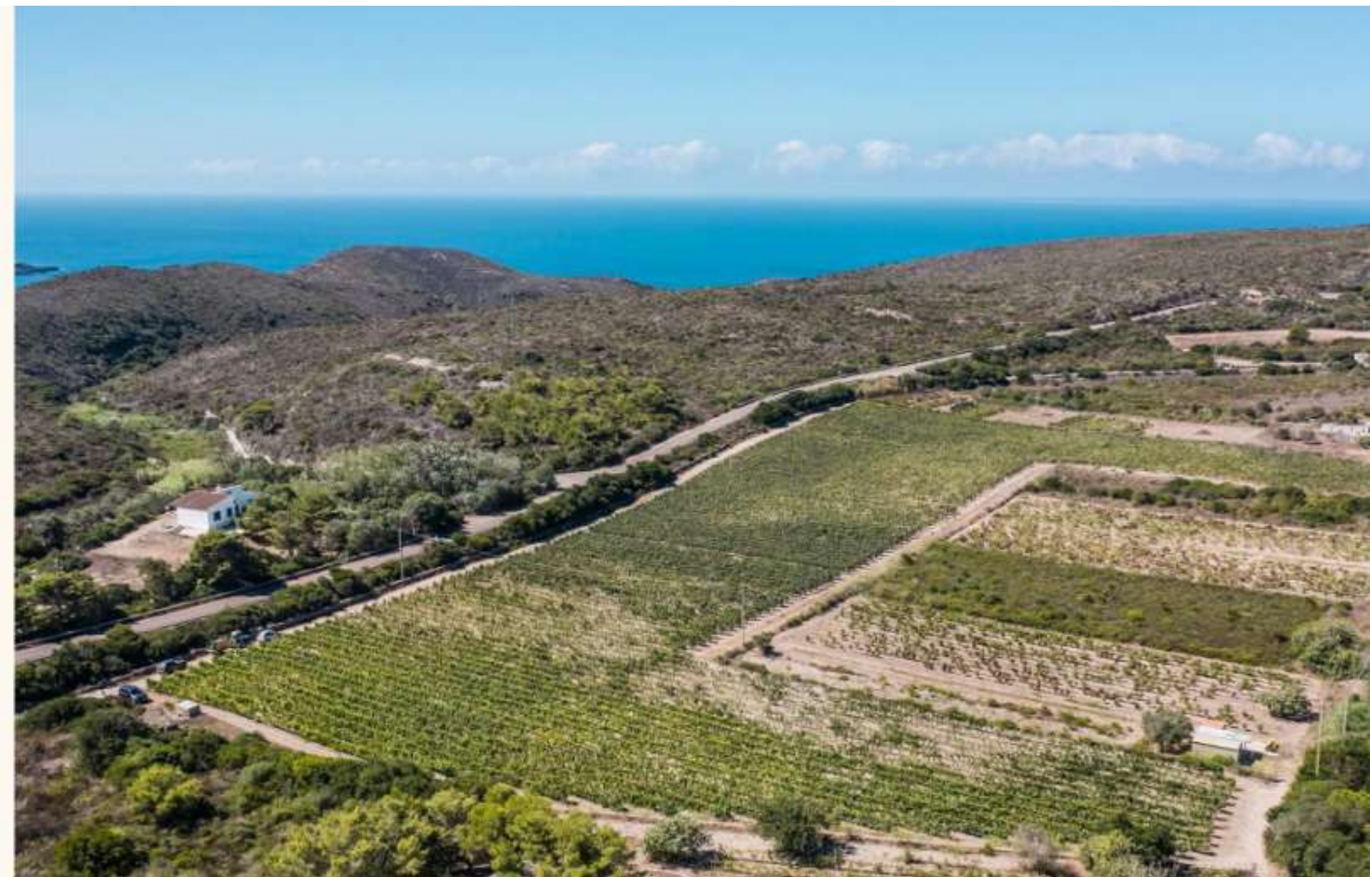
ISOLA DI SAN PIETRO