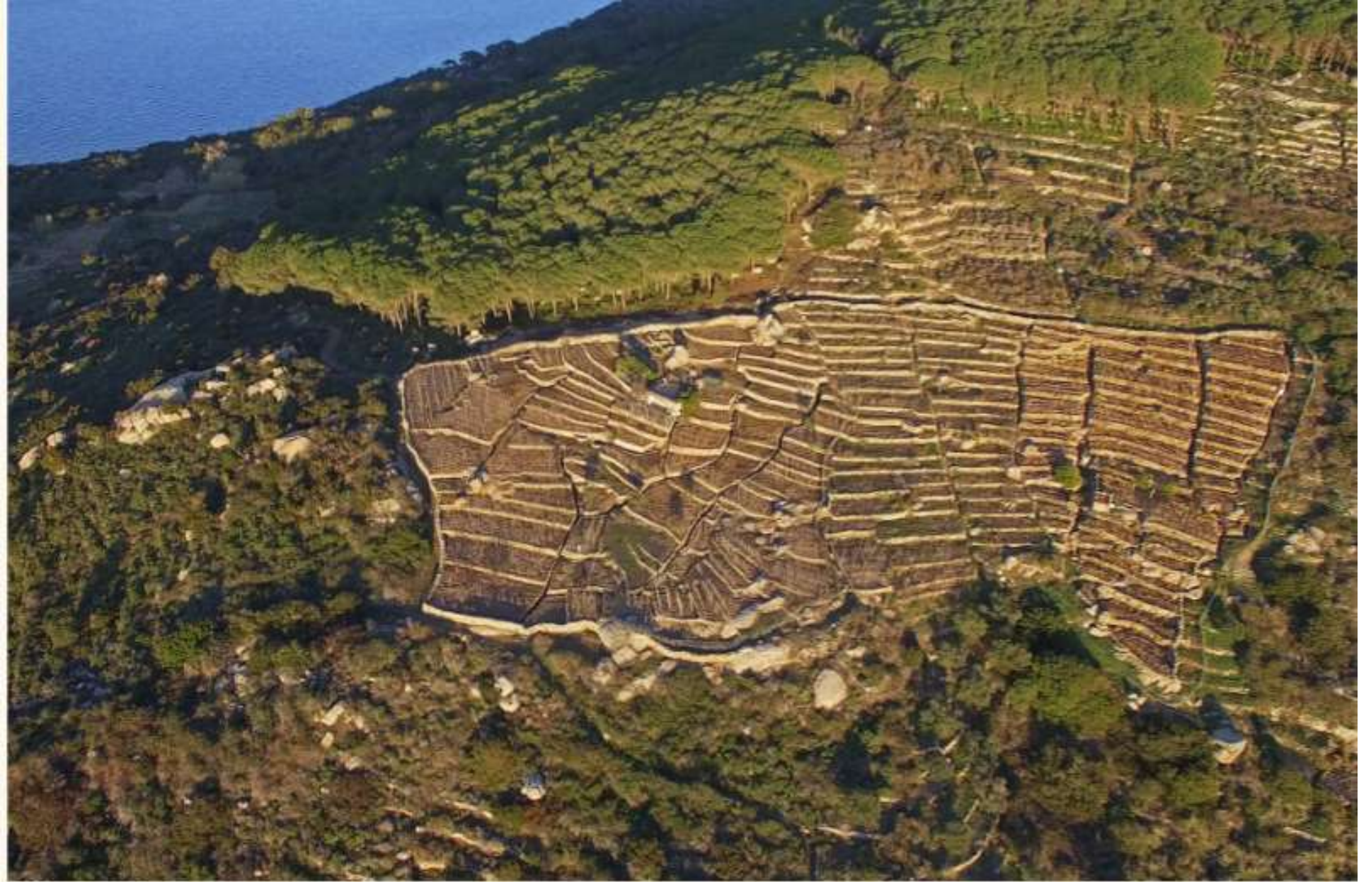
ISOLA DEL GIGLIO