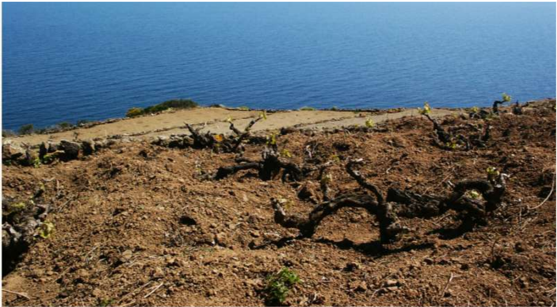
ISOLA DI PANTELLERIA