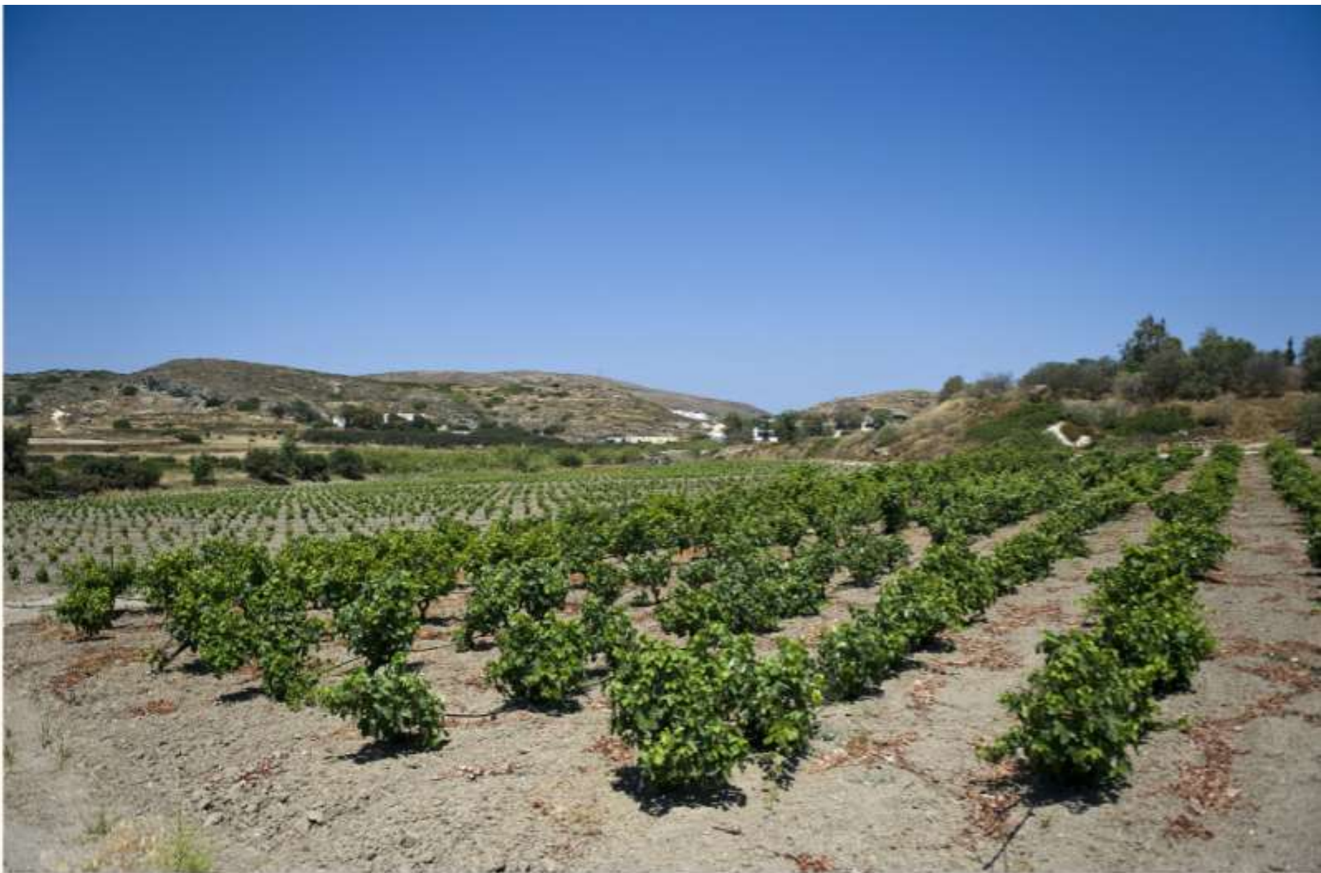
ISOLA DI MILOS