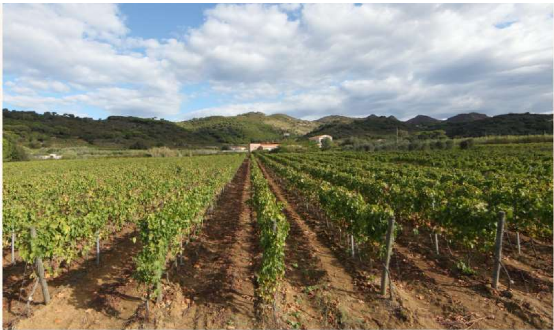
ISOLA D'ELBA -