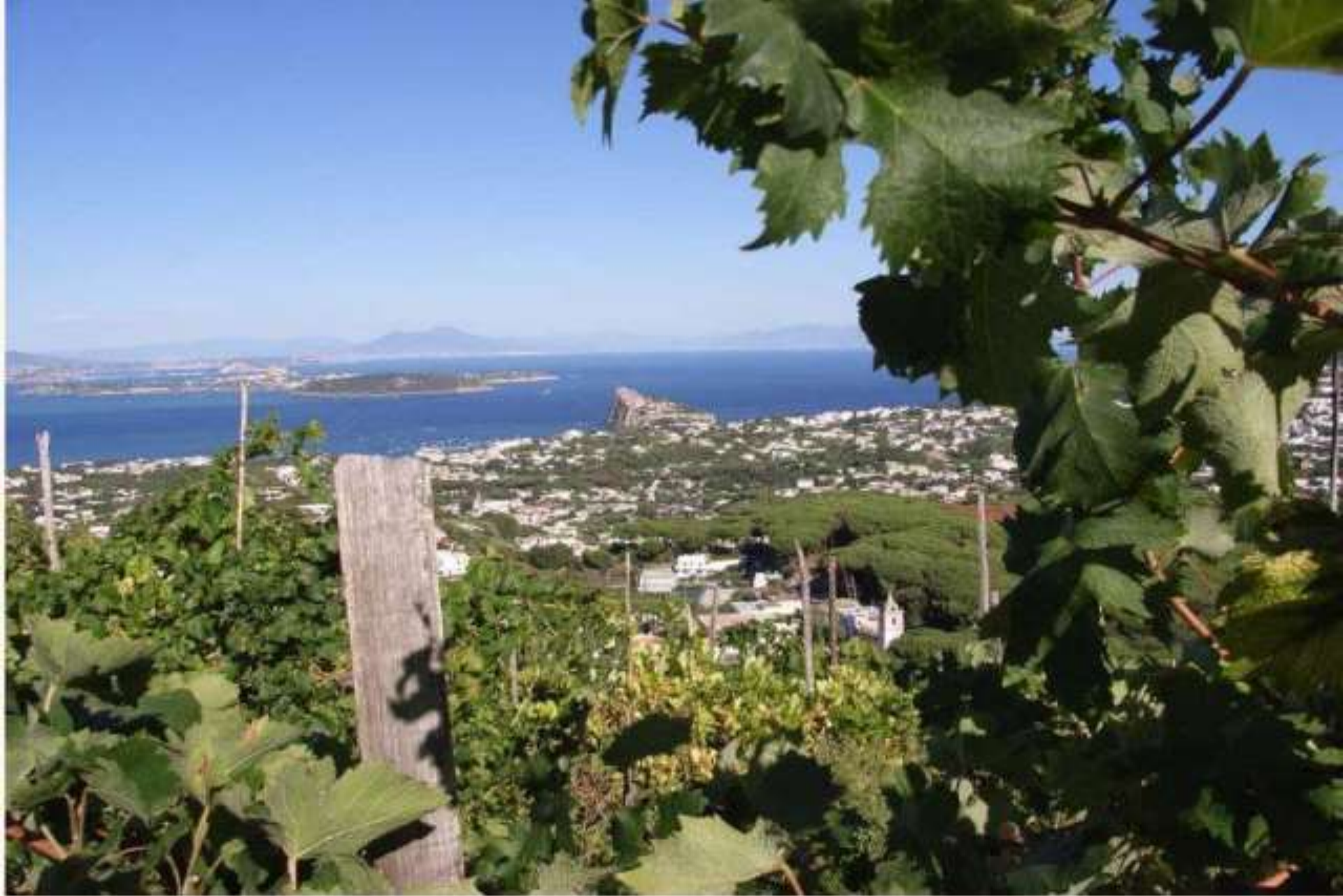
ISOLA DI SICILIA