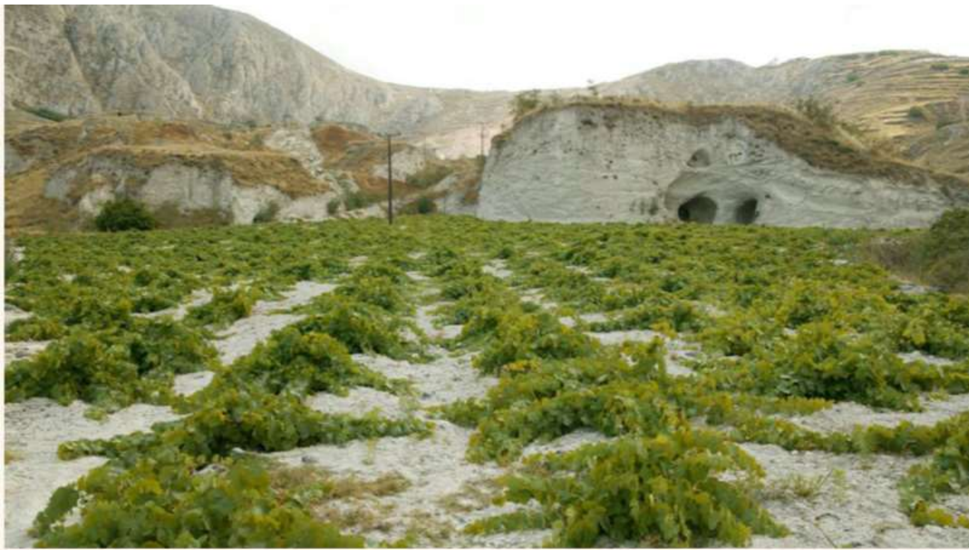
ISOLA DI SANTORINI