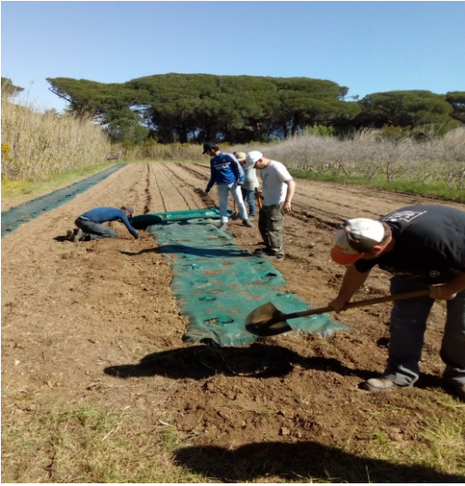
Cantiere di inserimento