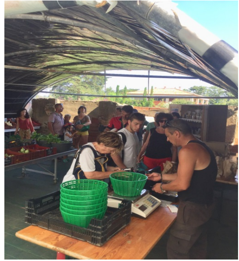
Vendita dei prodotti in circuito corto