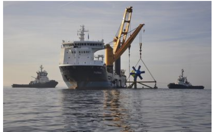
Immersion de l'hydrolienne dans le passage du Fromveur