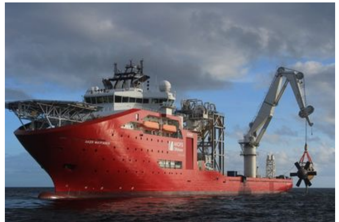
Relevage de la turbine D10 en juillet 2016