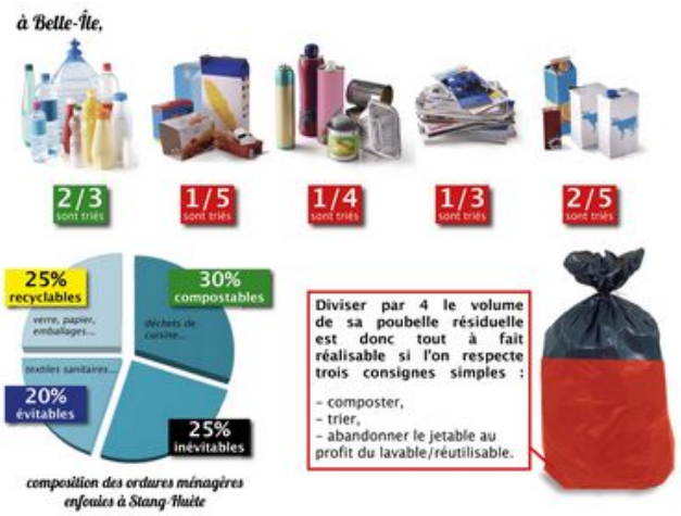
Composition des ordures ménagères enfouies à Stang-Huète