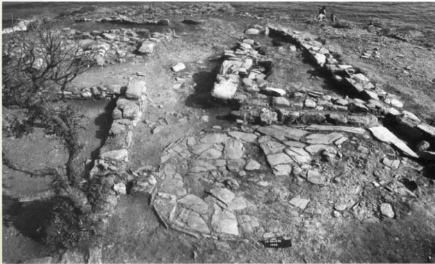
4 Quartier 3, habitation 1, état final de dégagement, vu de l'ouest.

Population de Grecs ( origine massiliote ) à l'anse de La Galère