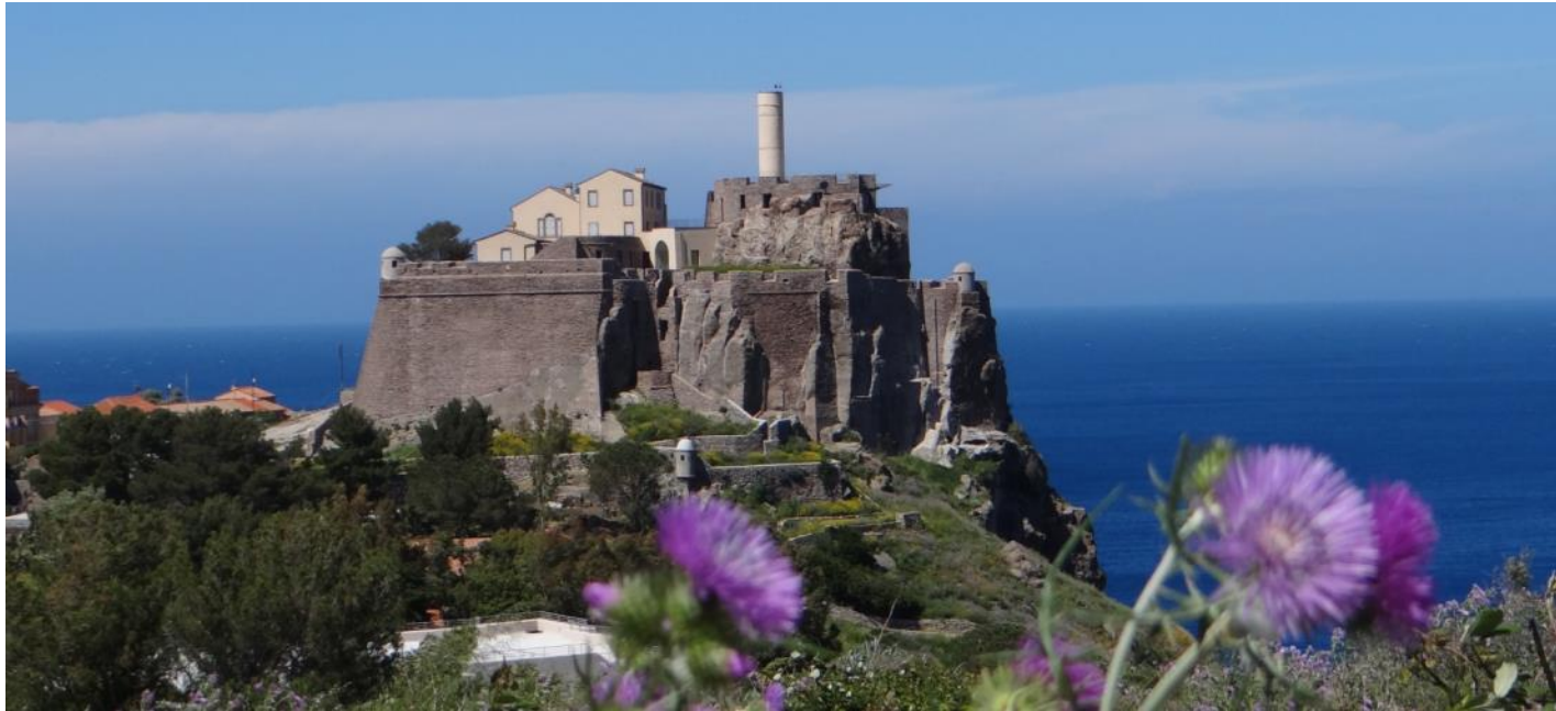
Isola di Capraia

Francesca Giannini/ Parco Nazionale Arcipelago Toscano - giannini@islepark.it Maria Ida Bessi/Comune di Capraia Isola – m.bessi@comune.capraiaisola.li.it Roberto Nieri/ ATO Toscana Costa - nieri@atotoscanacosta.it