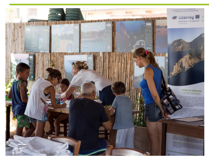
Adulti e bambini durante attività