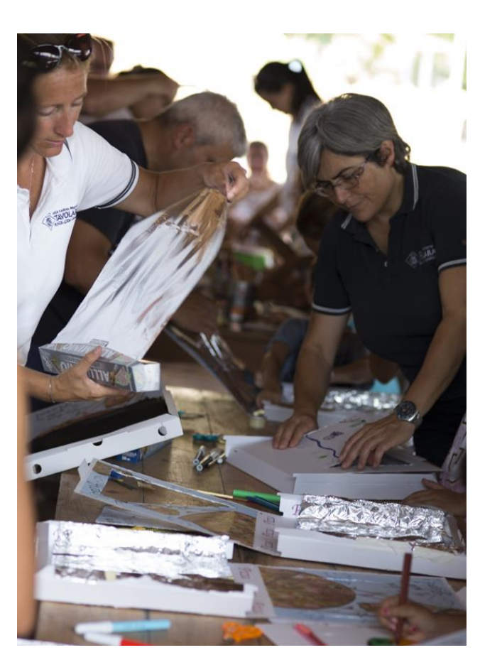
Costruzione forno solare con i cartoni della pizza